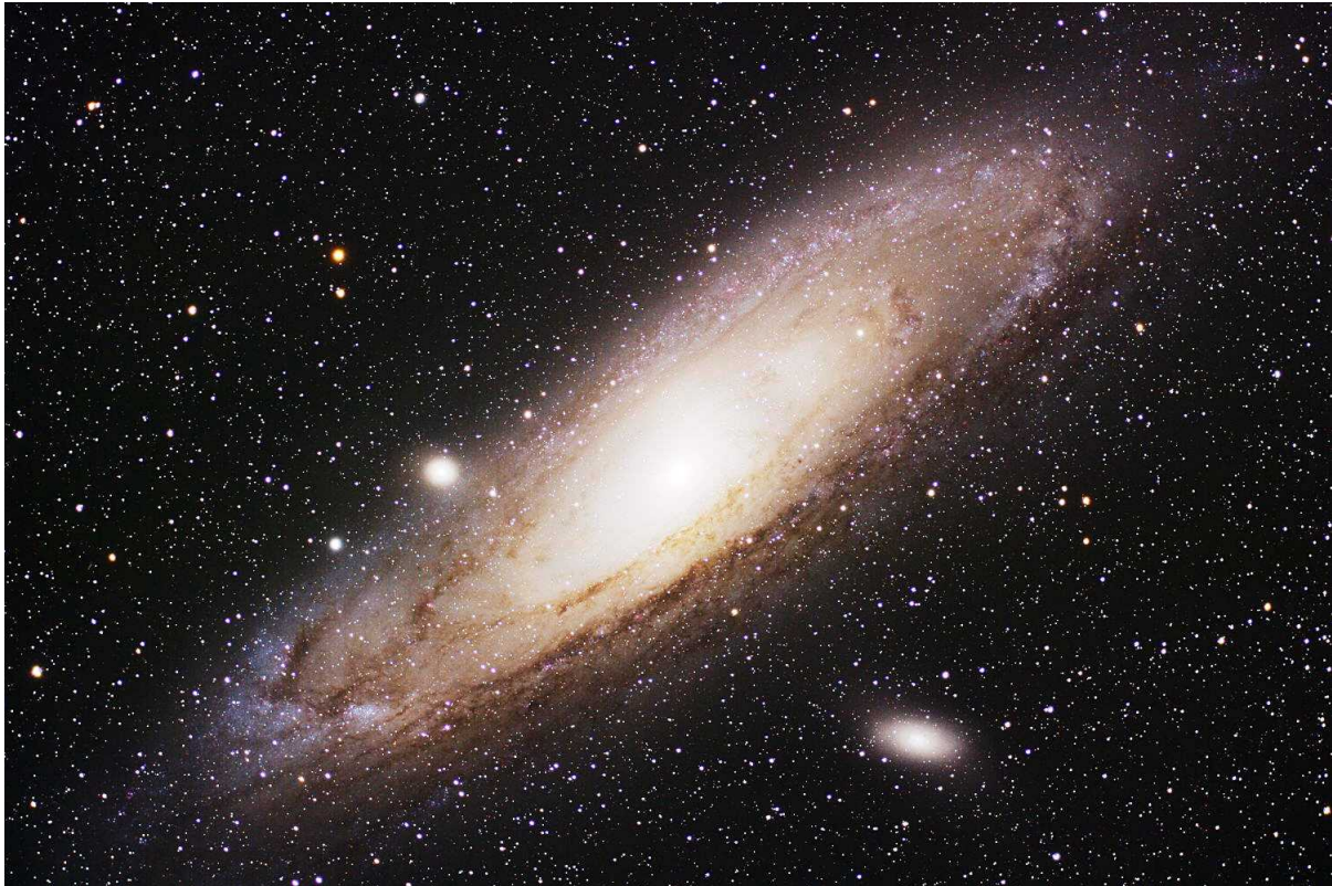
Abb. 8: M 31, 215 min belichtet mit Canon 20Da und Pentax 105 SDHF bei f/4.8.

In der Nacht von Samstag auf Sonntag fotografierte ich zudem den Andromedanebel, wobei hierzu mein altbewährter Pentax 105 SDHF Refraktor in Kombination mit dem Pentax 0.72x Reducer verwendet wurde. Die Belichtungszeit betrug wiederum gute 3.5 Stunden (vgl. Abb. 8).