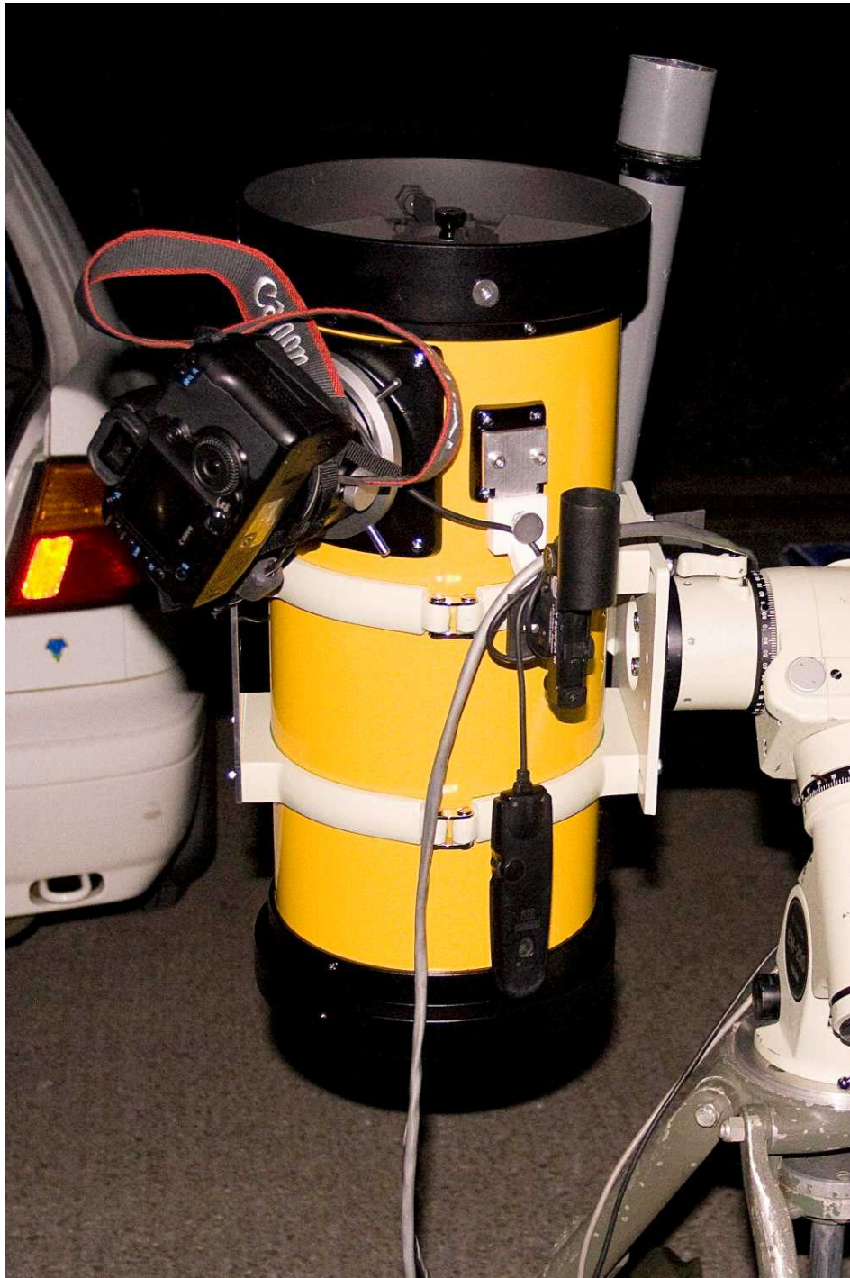
Abb. 5: Takahashi Epsilon 180ED f/2.8 Astrograph.

Einige Astrofotografen arbeiteten schliesslich mit Apo-Refraktoren, wie z.B. jener Teilnehmer, welcher mit seinem neu erworbenen Pentax 105 mm f/6.4 SDP-Refraktor auf den Gurnigel fuhr, um damit u.a. den Cirrus-Nebel aufzunehmen. Dieses Instrument gehört mit seinem korrigierten Bildkreis von 88 mm Durchmesser (dank fest eingebauter Bildfeldebnungslinse) sicherlich zu den besten derzeit käuflichen fotovisuellen Teleskopen im Brennweitenbereich zwischen 500 und 1000 mm (vgl. Abb. 6).