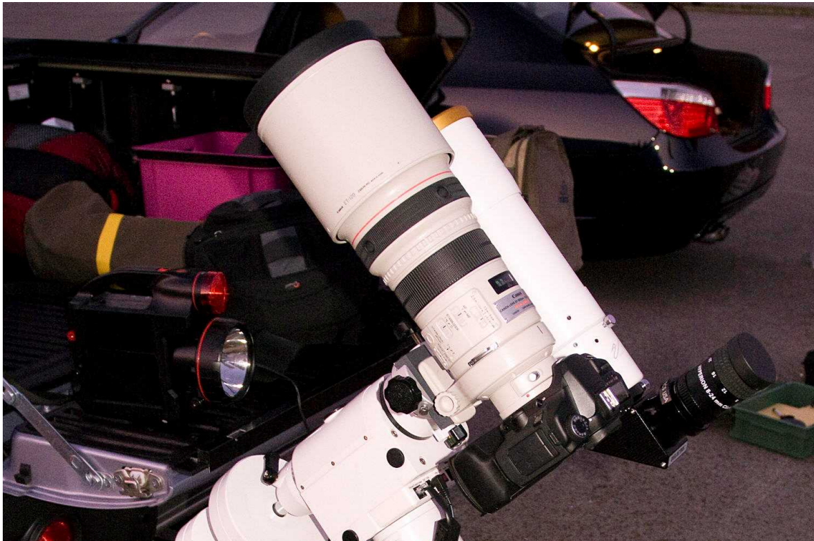
Abb. 4: 300 mm f/2.8 Canon-Tele für die Weitfeldfotografie.

Am diesjährigen Gurnigelpass-Treffen hat sich zudem auch der Trend fortgesetzt, die klaren Swiss Star Party Nächte auch für fotografische Arbeiten zu nutzen. Was früher an Teleskoptreffen eher verpönt war – sollen doch derartige Treffen auch den sozialen Austausch zwischen praktisch tätigen Amateuren fördern – ist heutzutage dank dem mittlerweile stark verbreiteten Autoguiding durchaus gut vereinbar mit einem Star Party Besuch. In diesem Jahr wurde auf dem Gurnigelpass hauptsächlich mit Fotoobjektiven, Apo-Refraktoren sowie speziellen Astrographen fernes Sternenlicht gesammelt. Dank dem Umstand, dass die Sommermilchstrasse Ende August das Himmelszelt nahezu ideal überspannt, fanden sich auf dem Gurnigelpass zahlreiche lohnende Fotoobjekte für Weitwinkel- bis mittlere Teleobjektive. So fertigte ein Teilnehmer Milchstrassenübersichten mit einem Fischaugen-Objektiv an, während ein anderer galaktische Nebel mit einem lichtstarken 300 mm f/2.8 Canon-Objektiv aufnahm (vgl. Abb. 4).