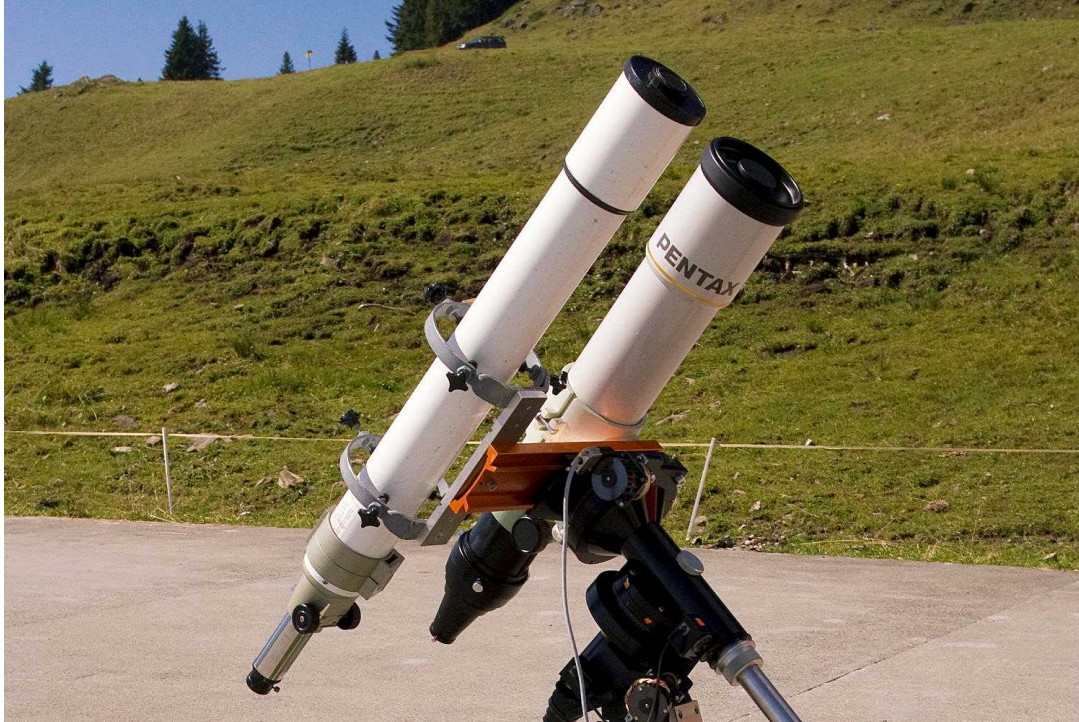
Abb. 6: Pentax 105/670 SDP, fotovisueller Astrograph.

Selber nutzte ich die beiden Star Party Nächte ebenfalls teilweise für die Astrofotografie. In der Nacht von Freitag auf Samstag stand ein Bild von Nordamerika- und Pelikannebel auf dem Programm, welches 3.5 Stunden lang mit meiner Canon 20Da durch einen kleinen Pentax 75 mm SDHF Refraktor mit zwischengeschaltetem Pentax 0.72x Reducer belichtet wurde (vgl. Abb. 7).