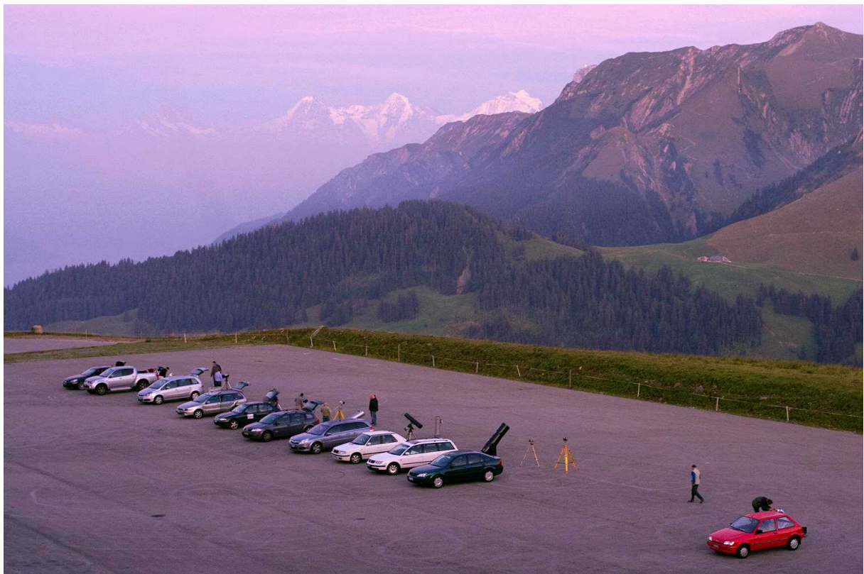
Abb. 1: Beobachtungsplatz der Swiss Star Party auf dem Gurnigelpass (1600 m ü. M.) mit Blick auf Eiger, Mönch und Jungfrau.

Ende August fand auf dem Gurnigelpass (1600 m ü. M.) in den Berner Voralpen die 20. Swiss Star Party statt. Gerade richtig zum runden Geburtstag dieses traditionellen Schweizer Teleskoptreffens verhies die Wetterprognose ein sternklares Star Party Wochenende. So war es nicht weiter erstaunlich, dass es in diesem Jahr besonders viele Sternfreundinnen und Sternfreunde von nah und fern mit ihren Teleskopen auf den Gurnigelpass zog. Sie wurden denn auch belohnt mit zwei klaren Spätsommernächten mit sehr angenehmen Temperaturen. Von den Gasnebeln im Schützen über die planetarischen Nebel der Sommermilchstrasse bis zu den ersten aufgehenden Objekten des Winterhimmels konnte angesichts des Austragungsdatums nahezu alles beobachtet und fotografiert werden, was ein astronomisches Beobachtungsjahr so zu bieten hat.