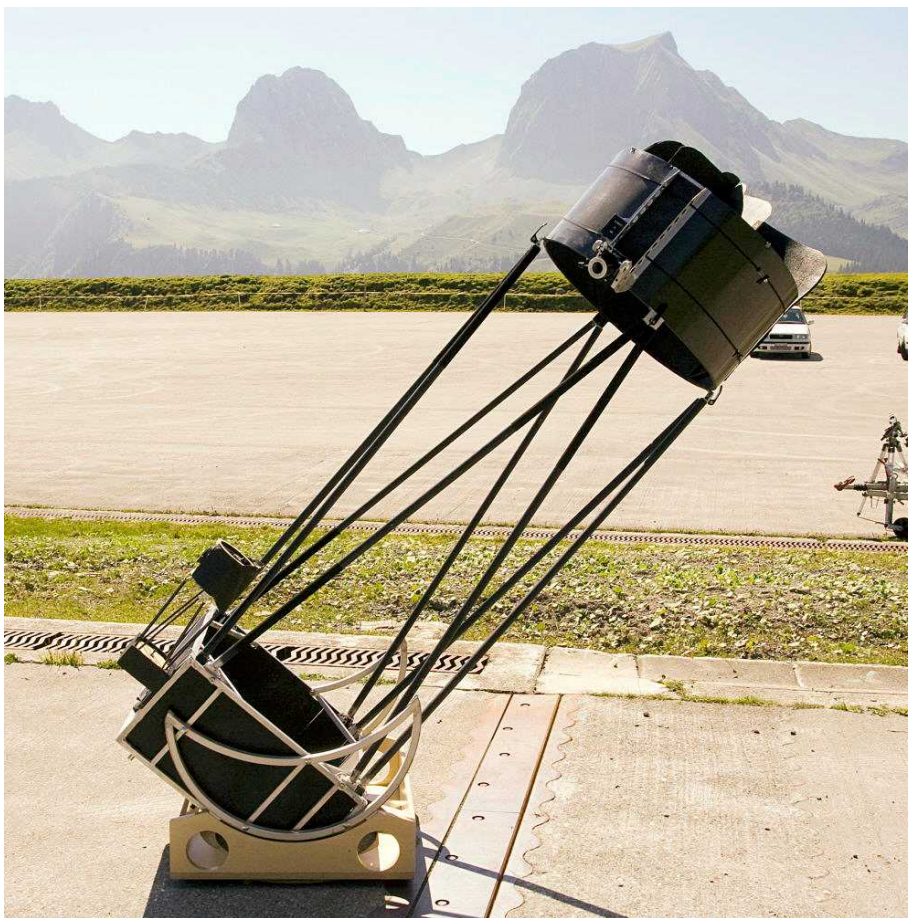
Abb. 2: 60 cm f/4.2 Lowrider Dobson mit nach unten verkipptem Okularauszug.

Das Teleskoptreffen auf dem Gurnigelpass ist charakterisiert durch eine nahezu ideale Kombination aus sehr gutem Nachthimmel, nahezu perfektem Südhorizont sowie sehr grosser Beobachtungsplattform (vgl. Abb. 1). Letztere ist zudem angesichts ihrer früheren Verwendung als Panzerschiessplatz extrem stabil gebaut, was der Aufstellung schwerer astronomischer Instrumente sehr entgegenkommt. Nahezu alle TeilnehmerInnen der Swiss Star Party bringen daher eines oder mehrere Teleskope mit, um die idealen Bedingungen für visuelle oder fotografische Beobachtungen sowie Teleskopvergleiche zu nutzen. Demzufolge ist das Gurnigeltreffen einer der besten Orte der Schweiz, um in einer Nacht unter klarem Himmel durch eine Vielzahl von Teleskopen zu blicken und sich dadurch ein gutes Bild zu verschaffen von den Vorzügen und Nachteilen unterschiedlichster Konstruktionen. Der Schwerpunkt der nachfolgenden Ausführungen soll deshalb den Teleskopen gelten, welche am diesjährigen Gurnigeltreffen aus verschiedenen Gründen besonders auffielen.