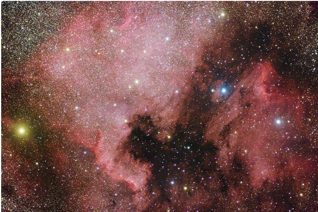
Abb. 7: NGC 7000 & IC 5070, 210 min belichtet mit Canon 20Da und Pentax 75 SDHF bei f/4.8.

Selber nutzte ich die beiden Star Party Nächte ebenfalls teilweise für die Astrofotografie. In der Nacht von Freitag auf Samstag stand ein Bild von Nordamerika- und Pelikannebel auf dem Programm, welches 3.5 Stunden lang mit meiner Canon 20Da durch einen kleinen Pentax 75 mm SDHF Refraktor mit zwischengeschaltetem Pentax 0.72x Reducer belichtet wurde (vgl. Abb. 7).