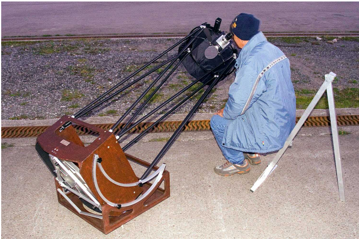
Abb. 3: 46 cm f/4.2 Lowrider Reisedobson, der bloss 21 Kilogramm wiegt.